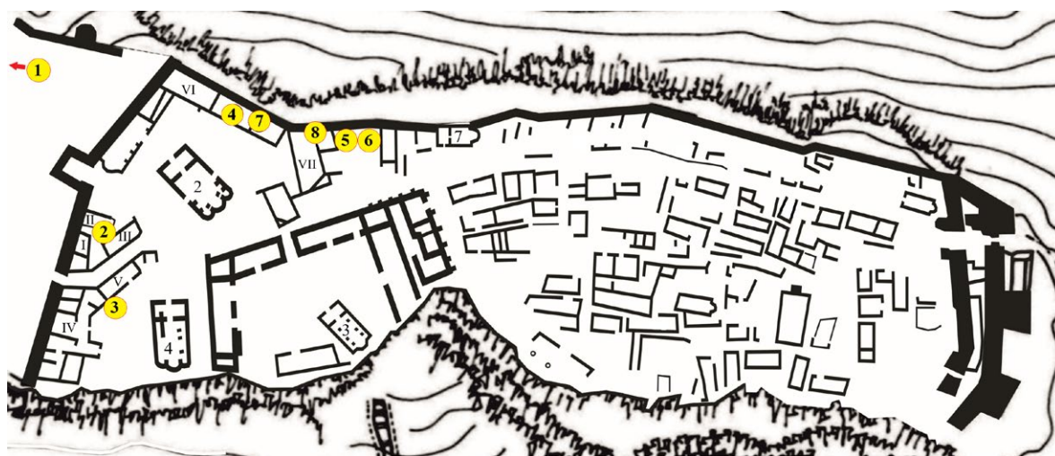
Обр. 5. План на цитаделата на Червен (по Ст. Йорданов) с отбелязани църкви № 2, 3, 4 и 7, сгради I – VII и приблизителните места на намиране на съдовете с монограми: 1. Камбановидна чаша със съкращение „Михаил“; 2. Паница с емблема на Св. 40 мъченици; 3 – 4. Купи с монограми на Червенския митрополит; 5 – 8. Образци с монограми, съставени от буквите К , Л , П , Р , Т (Автор: Г. Сенгалевич)