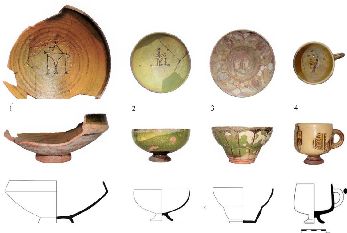
Обр. 1. Основни форми на византийската Elaborate Incised Ware: 1. Паница с монограм „Продромос“ от Кастрици; 2. Купа със съкращение „Михаил“ от Варна; 3. Камбановидна чаша с „Михаил“ от Варна; 4. Цилиндрична чаша с „Михаил“ от Варна (Sengalevich 2020, 187, fig. 2)