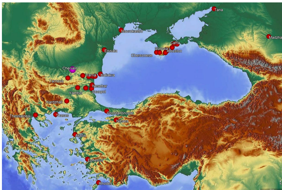
Обр. 3. Разпространение на византийската керамика със съкращения „Михаил“ от групата Elaborate Incised Ware с концентрация от Кримския полуостров и от Западното Черноморие: Созопол, Русокастро, Ямбол, Несебър, Варна, Кастрици, Калиакра, Провадия, Шумен, Червен, Търново и Кърджали (Автор: Г. Сенгалевиц)