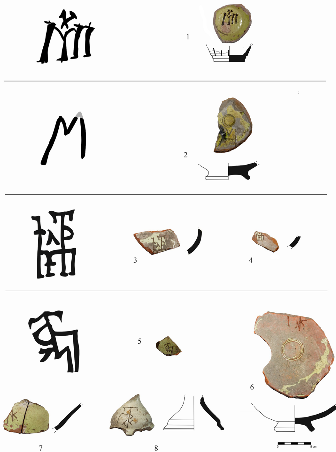
Обр. 2. Глазирана керамика със сграфито украса от подглазурни монограми от Червен: 1. Камбановидна чаша със съкращение „Михаил“; 2. Паница с емблема на Св. 40 мъченици; 3 – 4. Купи с монограми на Червенския митрополит; 5 – 8. Образци с монограми, съставени от буквите К, Л, П, Р, Т (Автор: Г. Сенгалевиц)